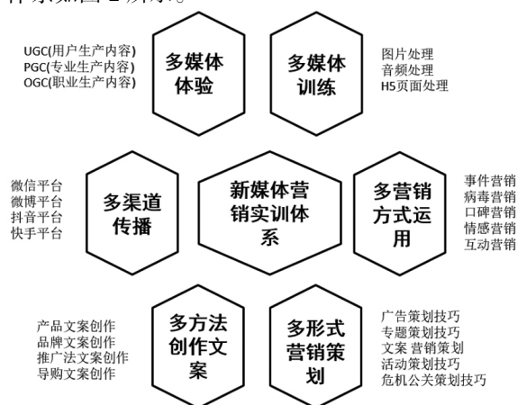
图 2 新媒体营销实训系统图

实践平台的搭建虽然基于新媒体生产运营的真实环节,但是只有在校企深度合作的实训体系中,学生才能得到真正的企业实操锻炼。校方引进当地好的新媒体企业,学生可以在实训中享受企业提供的产品货源、资金投入、物流平台及仓储等方面的资源。企业给学生分配运营账号,与企业员工一样进行监督管理,学生在实践的过程中边学习边实操,不断提升实践水平,实践的考核结果直接通过学生运营产生的业绩来体现,形成“多媒体体验+多媒体训练+多渠道传播+多营销方式运用+多方法创作文案+多形式营销策划”为一体的新媒体营销实训体系,确保做好新媒体复合型人才培养的最后环节。新媒体营销实训体系如图 2 所示。