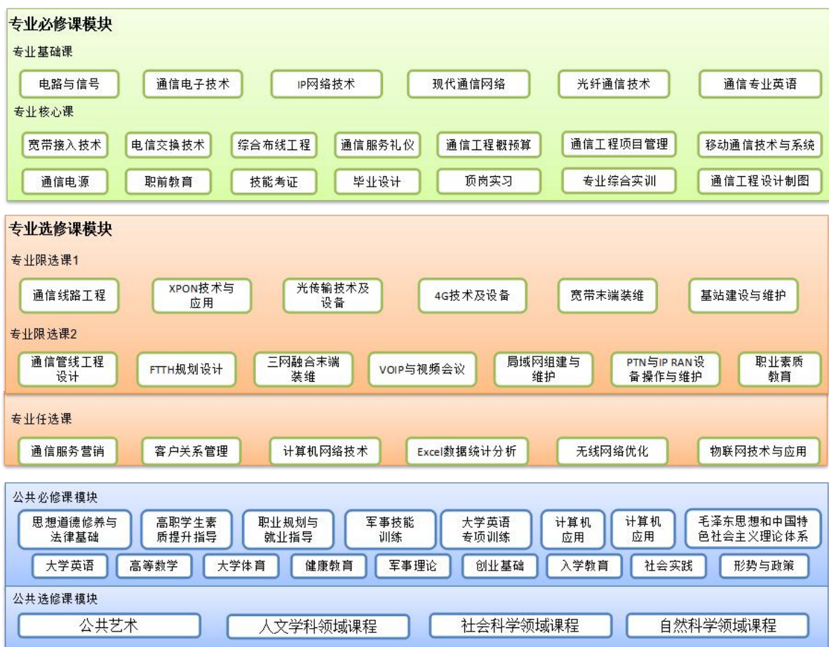
图 2 通信技术专业课程体系